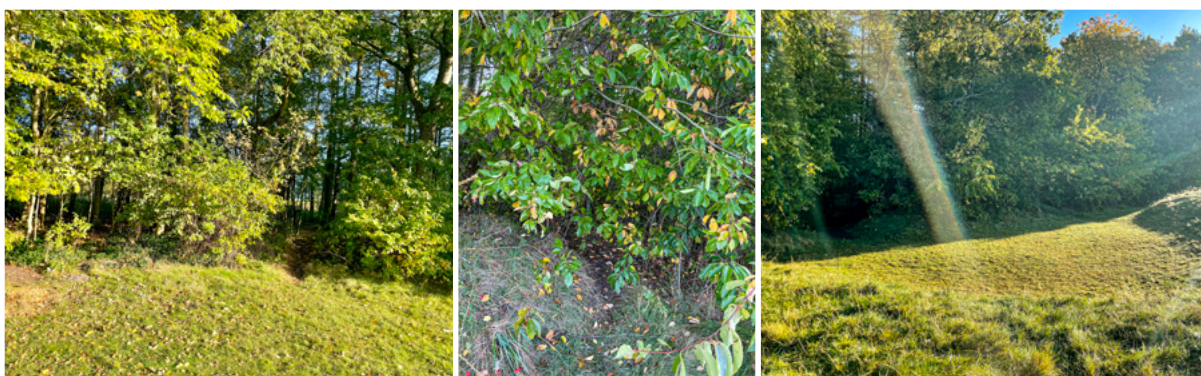
Billedkollage: Eksempler hvor vegetationen og terrænet skaber afskærmede kroge og niches.